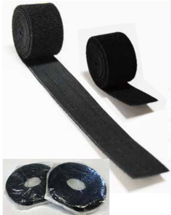
幅 25mm × 長さ 22m ノーカット製品

医療現場はもちろんの事、応急処置場面やスポーツ分野・ビジネス分野、その他さまざまな場面で幅広くご利用下さい。